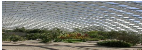
تصویر 15- گلخانه باغ ملی گیاه شناسی ولز

که مصرف انرژی در آن حدود یک چهارم میزان مصرف انرژی در ساختمان‌های مشابه باشد. فرم این ساختمان به مثابه عاملی مؤثر در دستیابی به اهداف اکولوژیکی در طراحی یکی دیگر از پروژه‌های موفق فاستر یعنی ساختمان دفتر مرکزی سوئیس ری در لندن است (1997-2004) که از اهمیت بسیاری برخوردار می باشد. این برج 41 طبقه با 76400 متر مربع زیربنا که به عنوان دفتر شرکت بیمه سوئیس ری در لندن طراحی شده است، اولین برج اکولوژیکی لندن به شمار می رود.