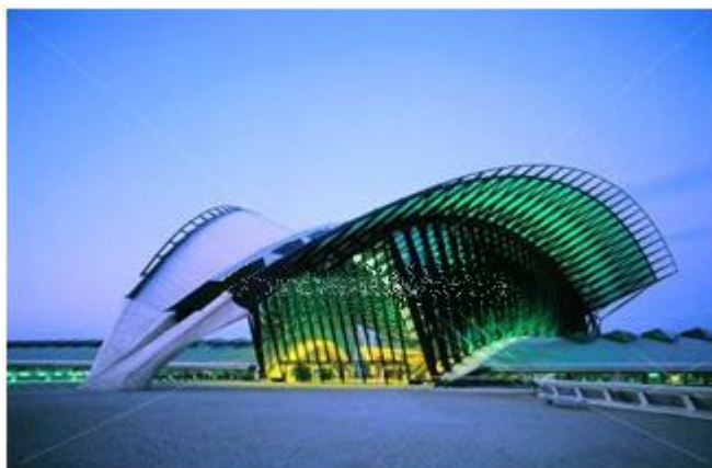
تصویر 13- ایستگاه راه آهن فرودگاه لیون

نگرانی دراز مدت کالاتراوا ساختن بنایی مانند یک چشم بود که پس از چند بار تلاش و آزمایش در مجسمه سازی ، نهایتاً به دیدگاهی رسید که مبنای طراحی ایستگاه راه آهن فرودگاه لیون شد. او بر این اعتقاد بود که ساختمان‌ها باید با محیط اطرافشان پیوستگی و ارتباط داشته باشند و یک بسته و منظر هرگز نباید ایستا و ساکن دیده شود و همواره موضوعات متحرک و پویایی وجود دارند. او این جنبه پویای محیط را می شناخت و در کار خود از آن استفاده می کرد.