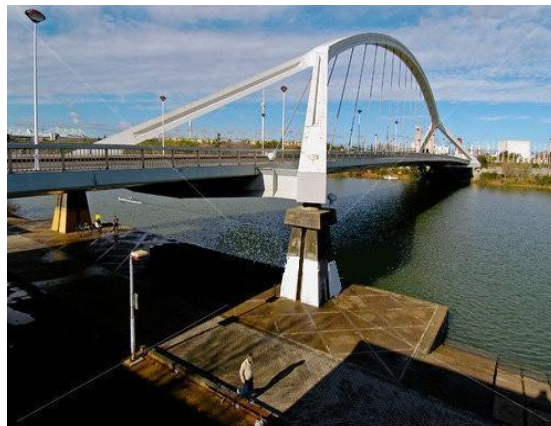
تصویر 14- پل آلامیلو در سویل اسپانیا